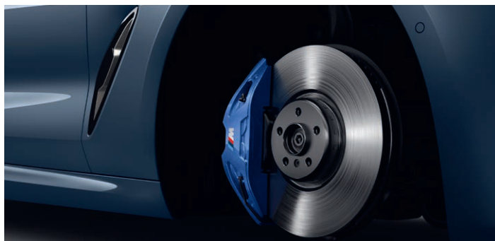
2NH – M sportovní brzdy