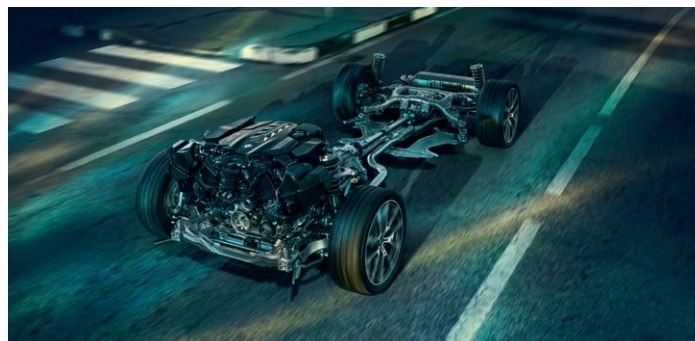
2VW – Adaptivní M podvozek Professional

Obrázky jsou ilustrativní. Změny v obsahu, jakož i tiskové chyby a omyly jsou vyhrazeny.