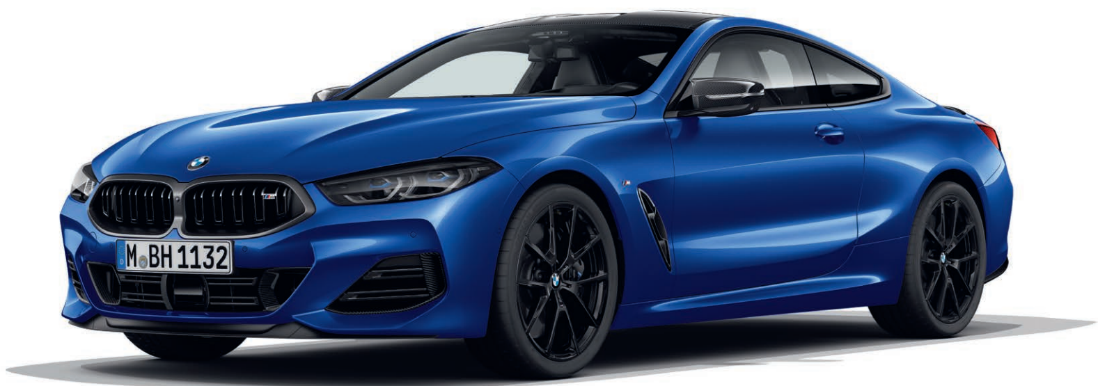
BMW 840d xDrive Coupé