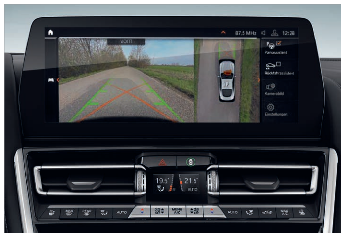
5DN – Parking Assistant Plus

Obrázky jsou ilustrativní. Změny v obsahu, jakož i tiskové chyby a omyly jsou vyhrazeny.