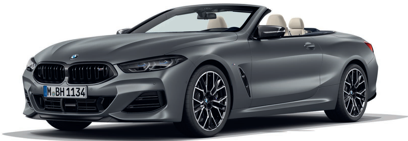
BMW 840d xDrive