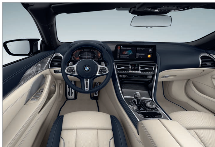
BMW Individual kůže Merino s rozšířeným obsahem