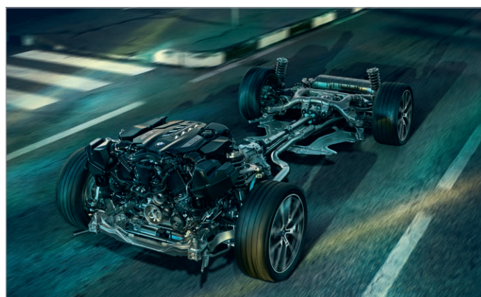
2VW – Adaptivní M podvozek Professional

Obrázky jsou ilustrativní. Změny v obsahu, jakož i tiskové chyby a omyly jsou vyhrazeny.