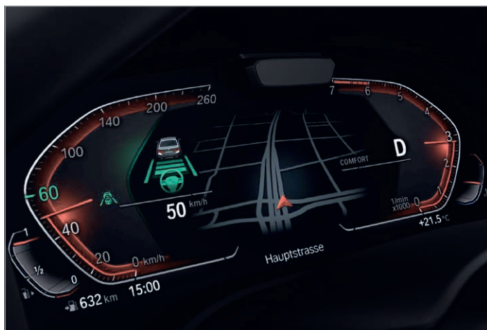
5AU – Driving Assistant Professional

- BMW Drive Recorder - umožňuje nahrávat video z okolí vozidla a přehrávat jej na kontrolním displeji nebo dokonce na jiných zařízeních po exportu přes USB. Důležité informace o vozidle, například rychlost a poloha GPS, se ukládají synchronně s videem.