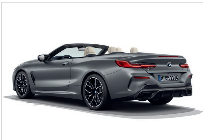
BMW 840d xDrive, zadní spodní nárazník s difuzorem v provedení Dark Shadow, koncovky výfuku světle chromované

Obrázky jsou ilustrativní. Změny v obsahu, jakož i tiskové chyby a omyly jsou vyhrazeny.