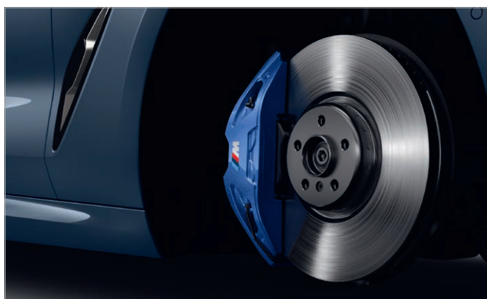
2NH – M sportovní brzdy