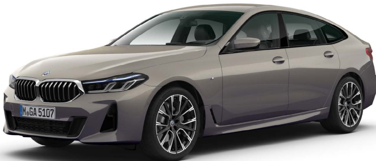
337 – M sportovní paket – BMW 640i xDrive, metalický lak Bernina Grey Amber Effect (volitelná výbava), 20" M kola z lehké slitiny Star-spoke 817 M Bicolour (volitelná výbava), Driving Assistant Professional (volitelná výbava)