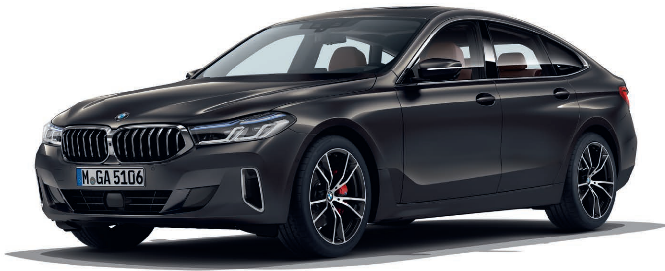
7S2 – Luxury Line – BMW 640d xDrive, BMW Individual metalický lak Dravit Grey (volitelná výbava), 20" kola z lehké slitiny V-spoke 686 (volitelná výbava)